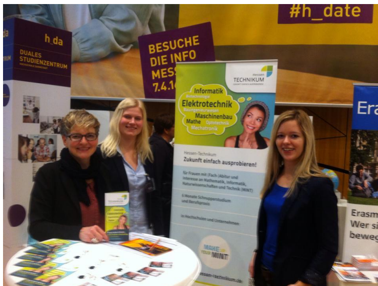
Das Hessen-Technikum auf der hobit 2016