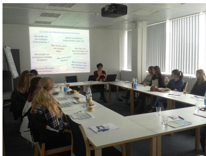
Exkursion zum MentorinnenNetzwerk