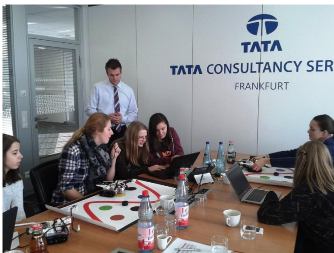
Exkursion zu Tata Consultancy Services