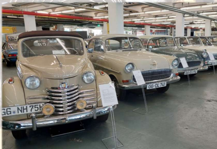
Fahrzeuge in der Opel Classic Werkstatt