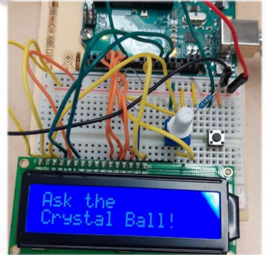
Programmierung einer Textausgabe an einem Arduino

Kennenlernen verschiedener Berufsbilder im Unternehmen durch Gespräche mit Mitarbeiter*innen und Führungen im Werk